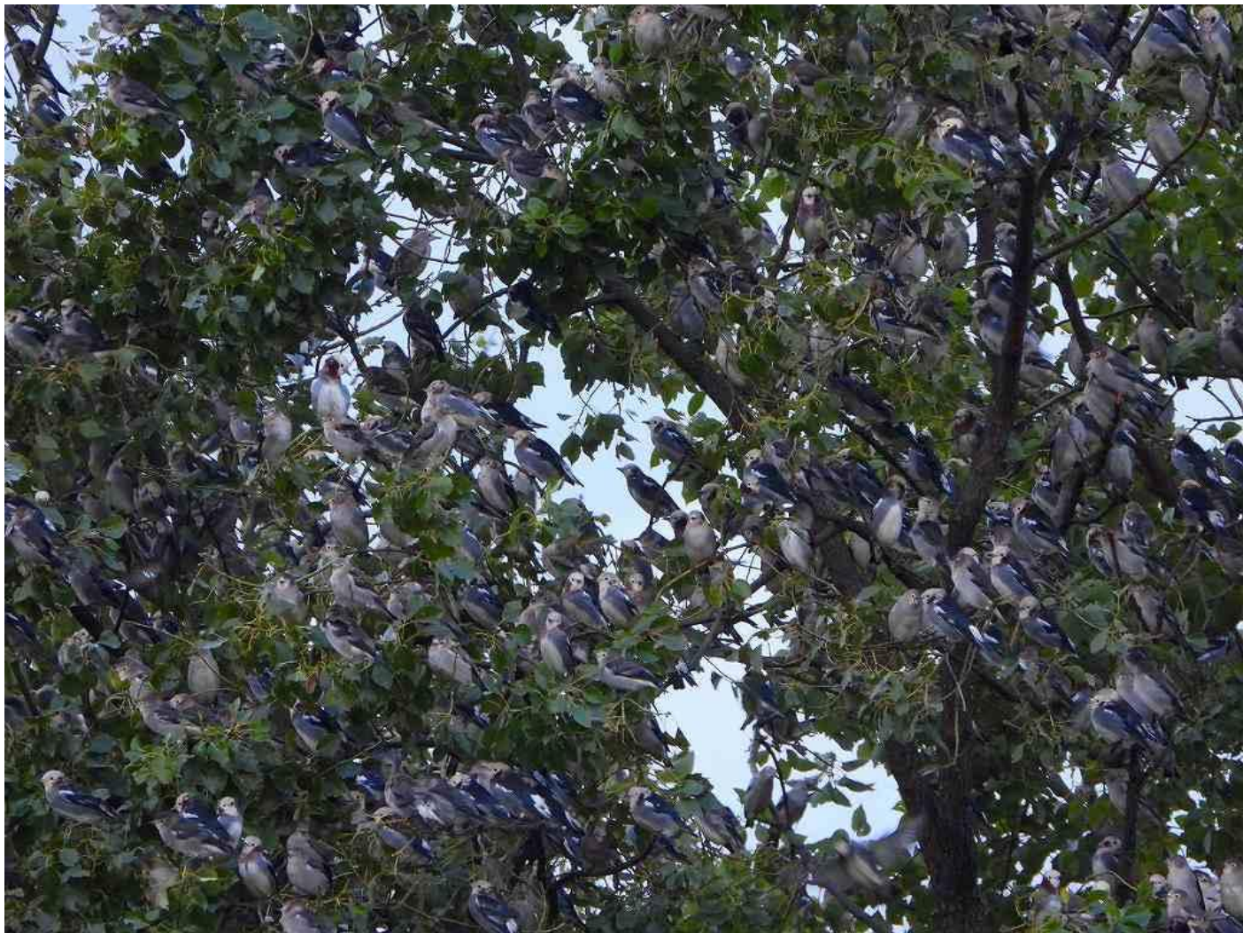
▲クスノキに群れているコムクドリ（筑後市：10月2日）