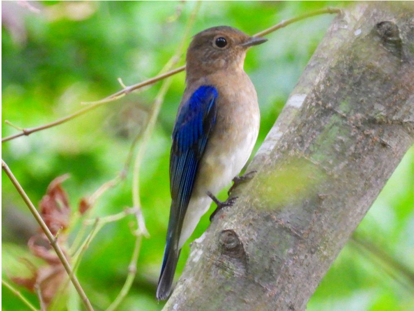
▲オオルリ雄幼鳥（北山ダム）