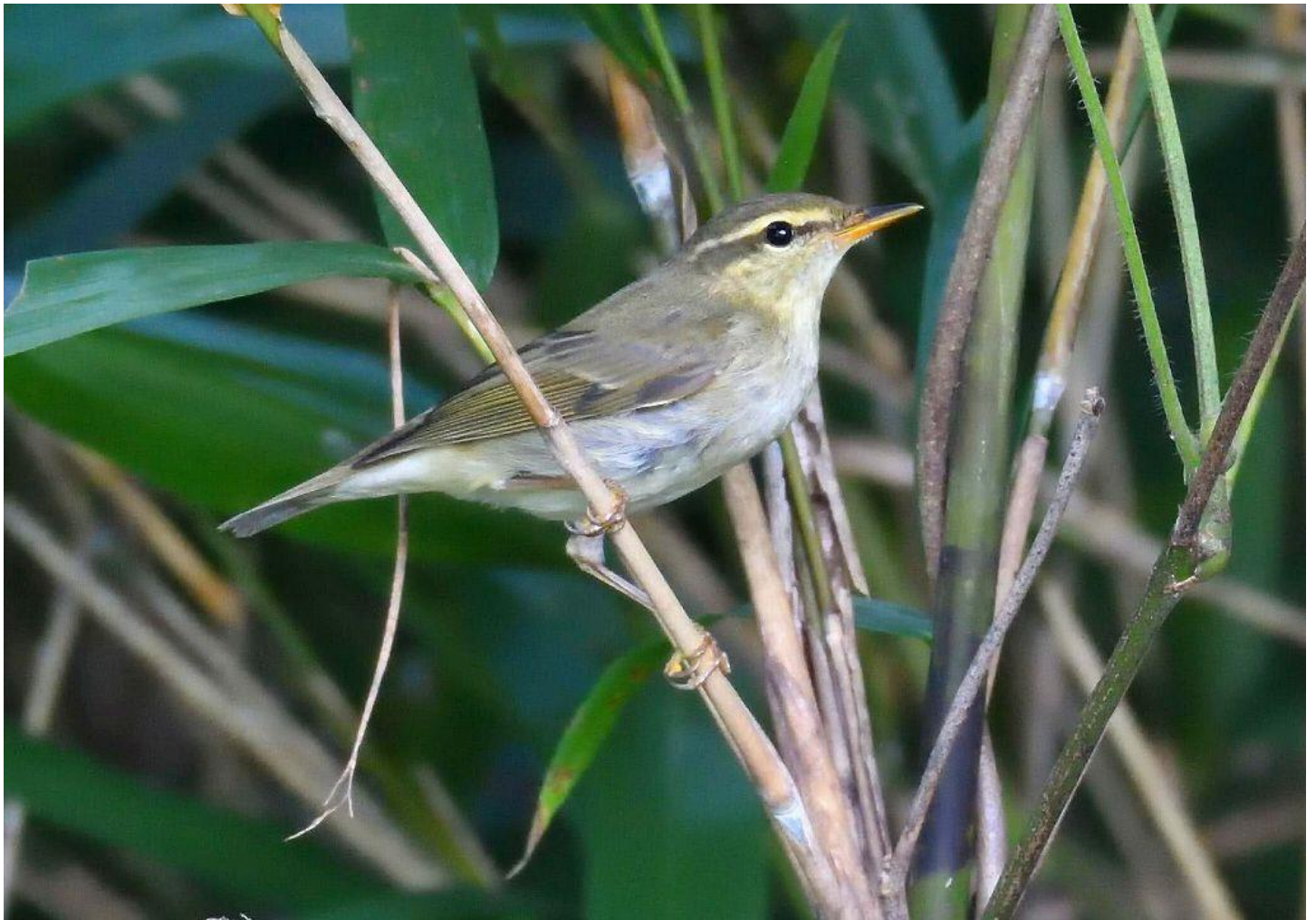
▲ムシクイ類（コムシクイか？：大津山公園）

Mt. Sige さんが、ムシクイを見た！と言われ、時間がなく帰宅されましたが、ムシクイの話があり、待つと夕方に現れました。