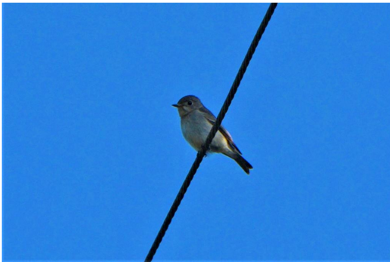
▲コサメビタキ（鷹取山）