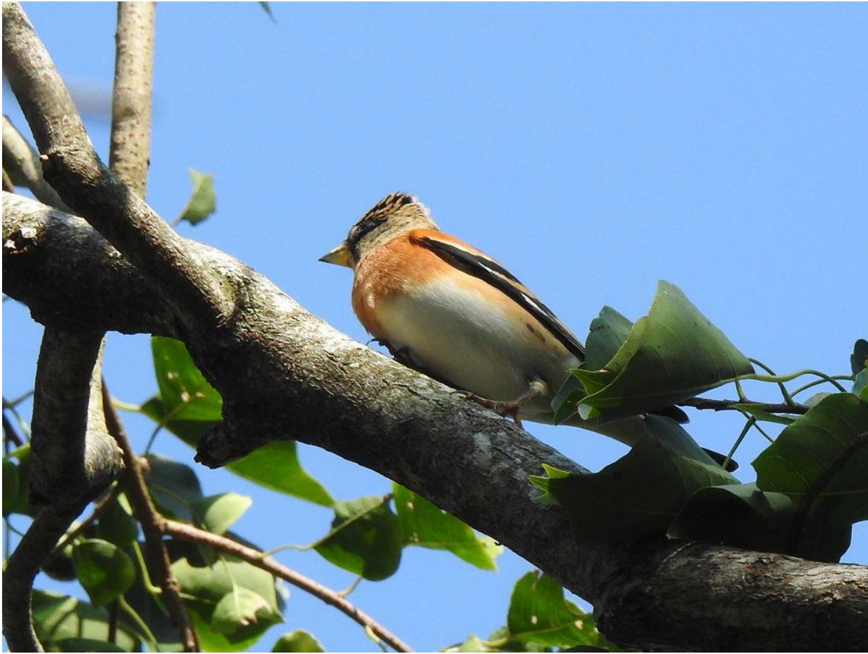
▲アトリ（立花山）

サシバの渡り調査で清水山に行きました。数羽の渡りで、多くの群が渡って行ったという印象はありませんでしたが、8日の夕方に100羽近くが出たと情報を受けました。