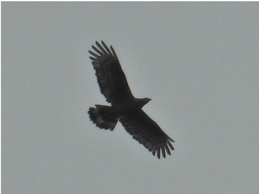
▲ハチクマ（北山ダム上空）