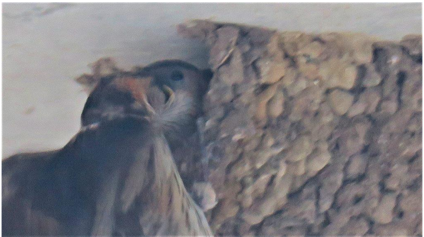
▲コシアカツバメの育雛（うきは市）