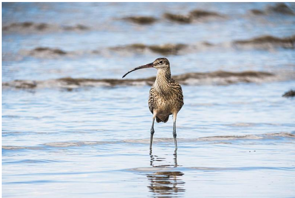
▲シギ（ホウロクシギか？：東与賀干潟）

趣味で写真撮影をやっておりますが、その中で野鳥撮影に出会い、野鳥に興味を持つようになりました。