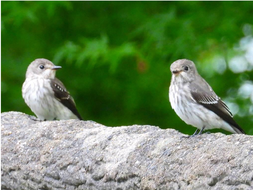
▲エゾビタキ（北山ダム）