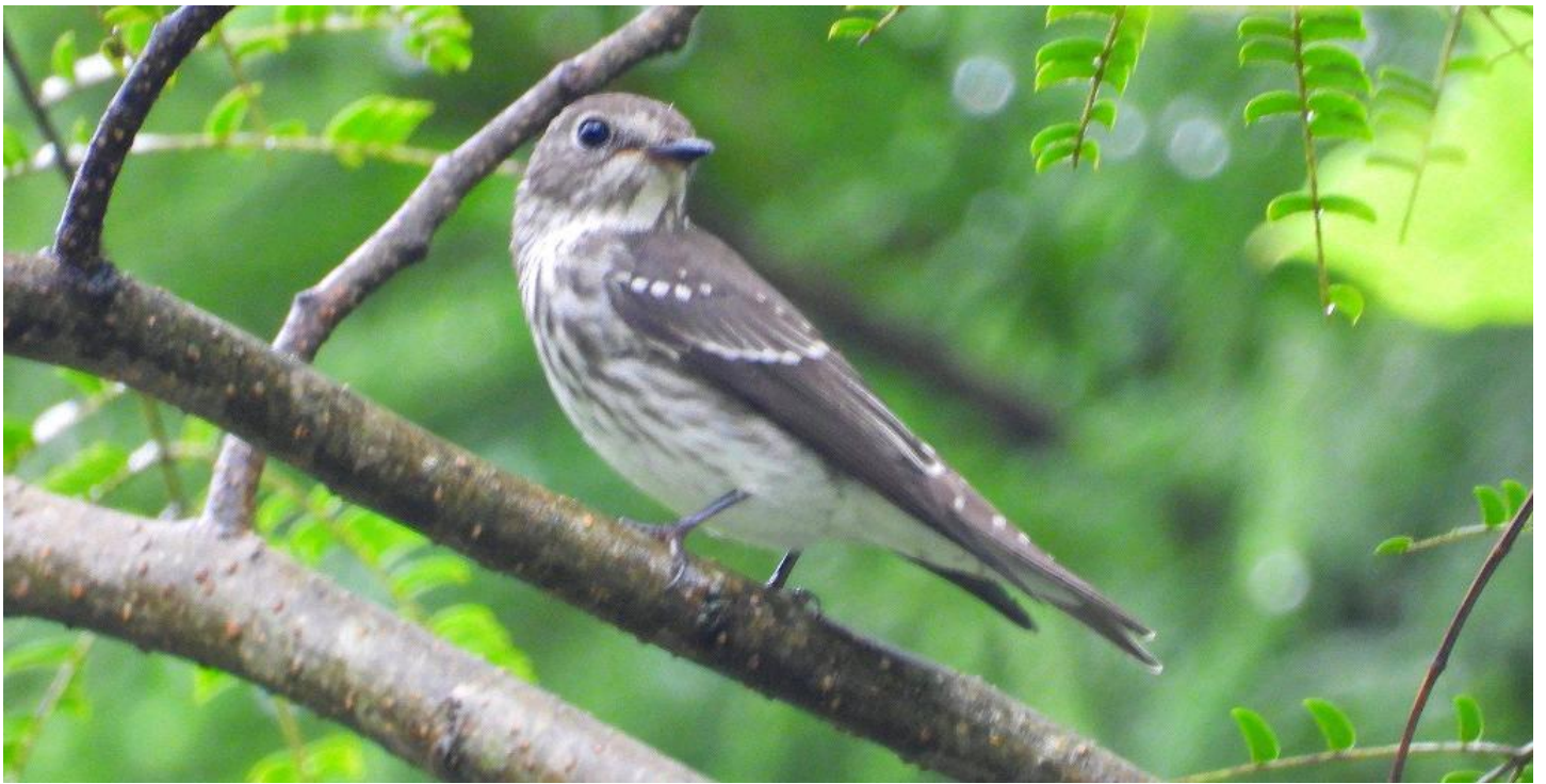
▲エゾビタキ（大津山公園）

Mt. Sige さんが、ムシクイを見た！と言われ、時間がなく帰宅されましたが、ムシクイの話があり、待つと夕方に現れました。