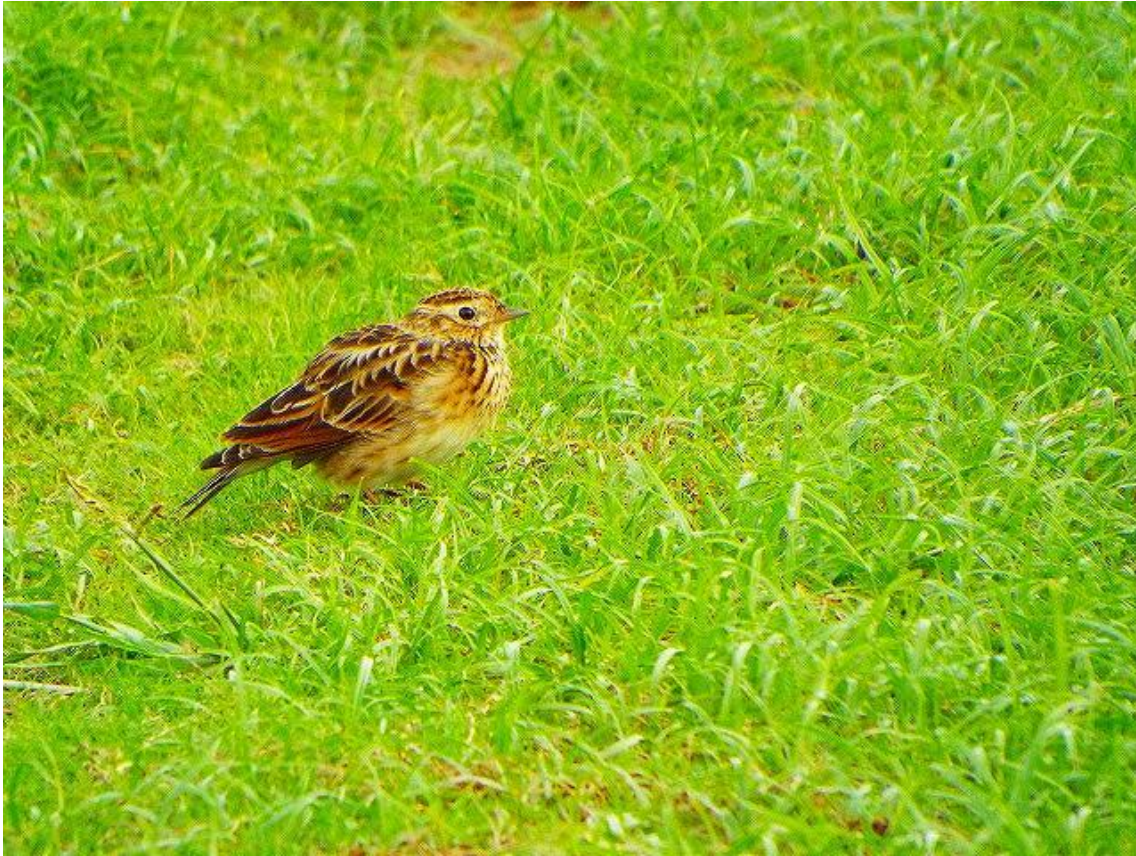
▲ヒバリの幼鳥（田主丸町）

朝の8時頃に、田主丸町巨瀬川の近くのあぜ道にいました。多分、ヒバリの幼鳥と思うのですが。