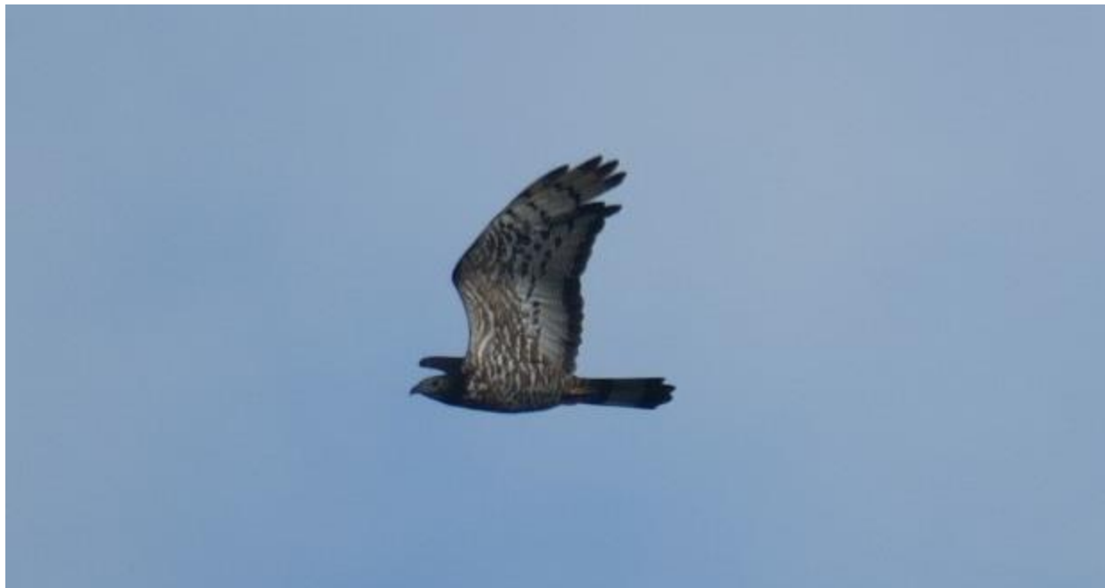
▲ハチクマ（烏帽子岳）

佐世保の烏帽子岳にハチクマの渡りを見に行きました。山頂は風が強くて寒いくらいでした。南方から北方の対馬方面へ、高く空をスーッと飛んで行く鷹がいます。ハチクマです。4時過ぎ頃に8羽くらいのハチクマが上空をまるで鷹柱のように回りながら飛んで行きました。