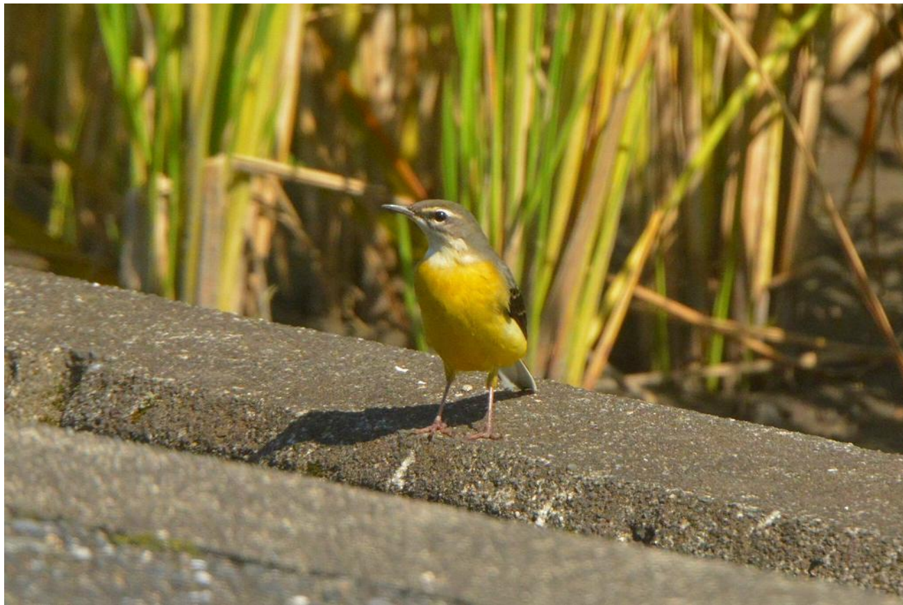
▲キセキレイ（田主丸町）

コガモの渡来や渡り鳥のコムクドリなど秋めいて来ましたね。私の家の前にもキセキレイが来ました。ダイハツ調整池にもコガモが来て、アオアシシギやクサシギなど冬のメンバーがそろっています。鷹取山では電線にヒタキが止まっていました。