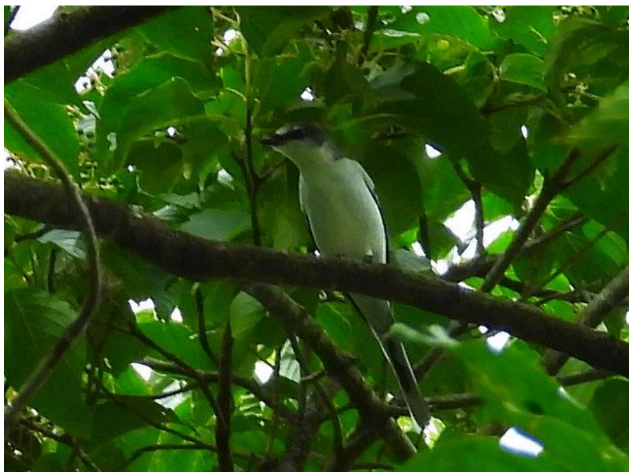
▲リュウキュウサンショウクイ（背振山）

その後、北山ダムでは、レストラン「ほおの木」の脇の樹木にはオオルリ雄幼鳥が現れ、コンクリ・ガードには2羽のエゾビタキがいました。上空高くには1羽の鷹が舞っていて、雲で暗くよく分かりませんでしたが、帰って画像をよく見ると翼の内側や尾羽の縞模様からハチクマとわかりました。