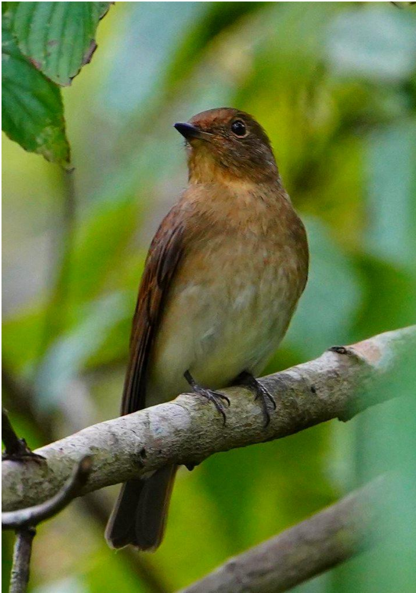
▲オオルリの雌（大津山公園）

佐賀空港に午後2時過ぎに出かけ、じっくりと探した積りでしたが、やはり鳥は現れてくれません。そのうち、遠くでホバリングしているチョウゲンボウを発見しました。この秋、初認です。