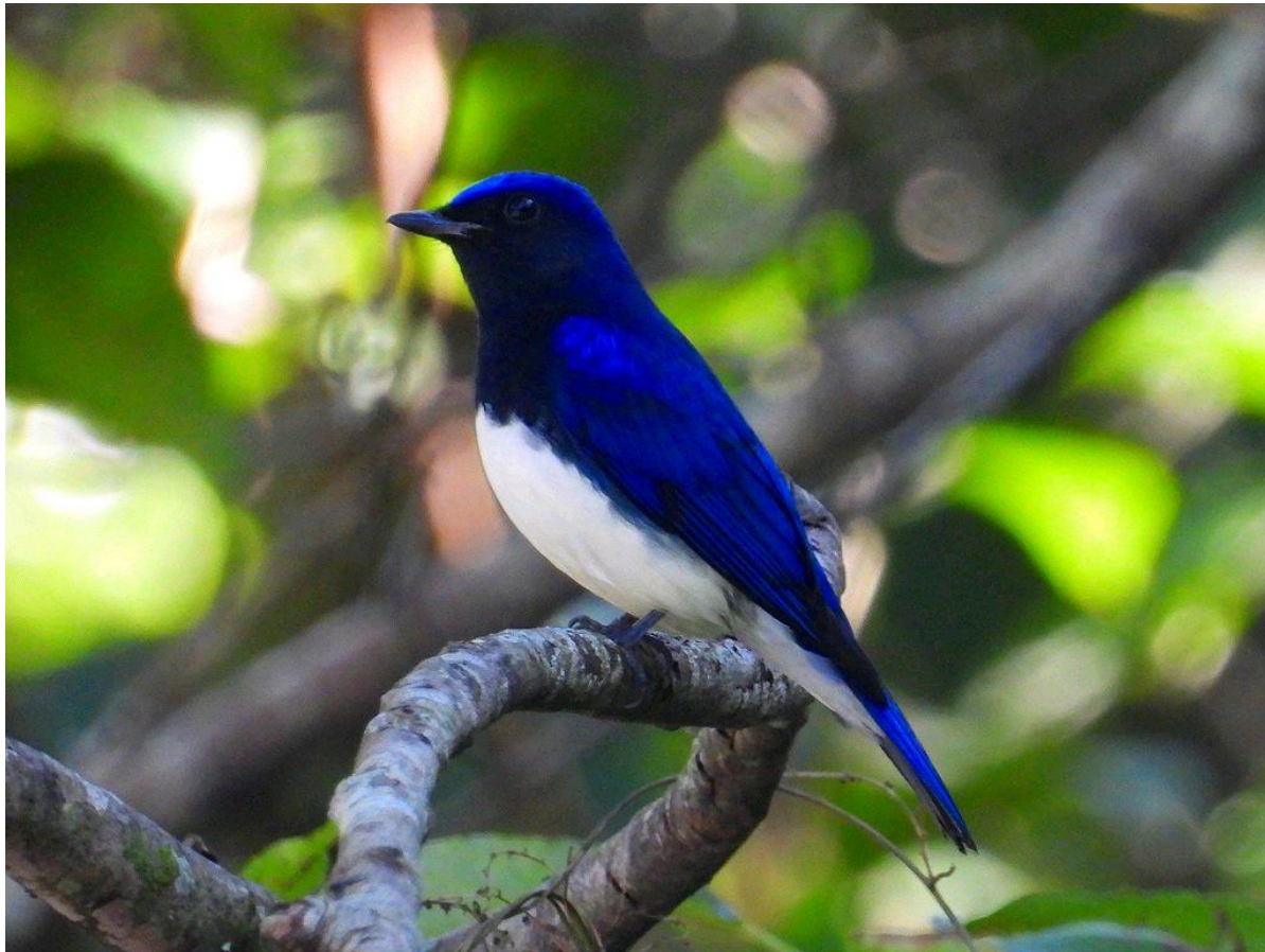
▲オオルリの雄（大津山公園）

大津山(熊本県南関町)ではヒタキ三兄弟(大半はエゾビタキ)、オオルリ、キビタキ、カラ類等がいます。溜め池の近くに3本のクマノミズキがあり、かなり群れて熟した実をつついていました。オオルリは雄が2羽いて、雌も数羽います。キビタキも樹間を行ったり来たりし、車道やガード・レールに下りたりと、忙しく飛び交っています。未だ実が少し残っているので、もう少し観察が出来そうです。アオゲラも近くで甲高い鳴き声が聴けますが、なかなか姿を見ることが出来ません。