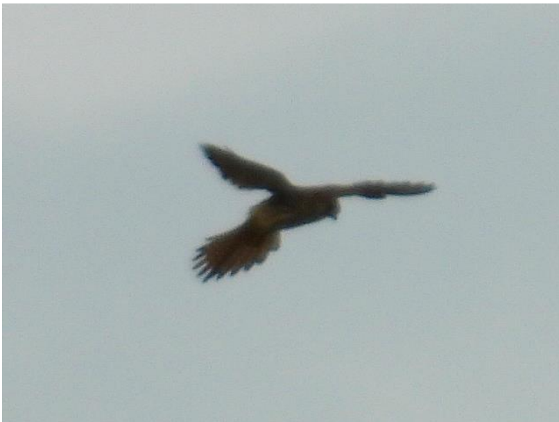
▲チョウゲンボウ（佐賀空港）

佐賀空港に午後2時過ぎに出かけ、じっくりと探した積りでしたが、やはり鳥は現れてくれません。そのうち、遠くでホバリングしているチョウゲンボウを発見しました。この秋、初認です。