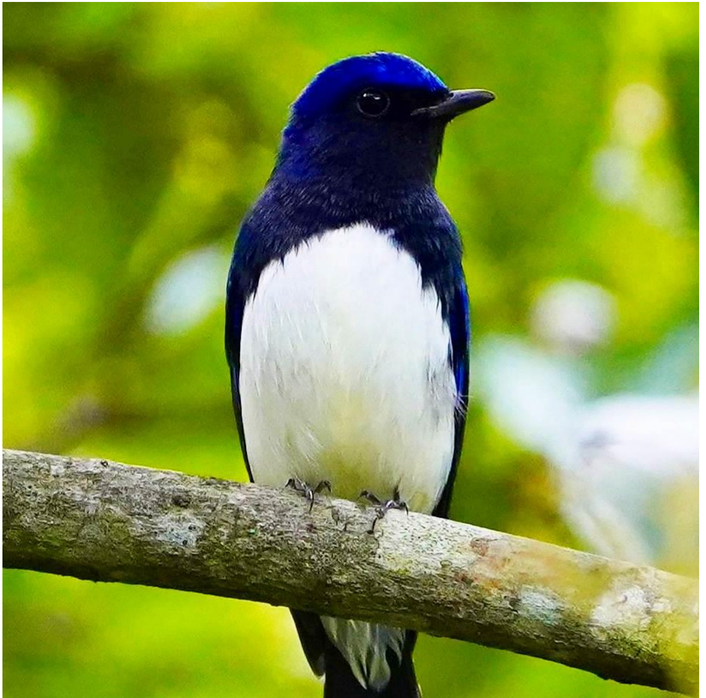
▲オオルリの雄（大津山公園）