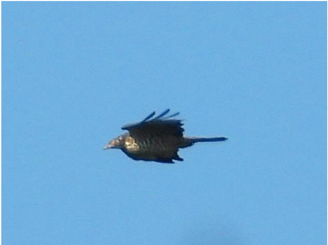
▲ハチクマ（清水山）