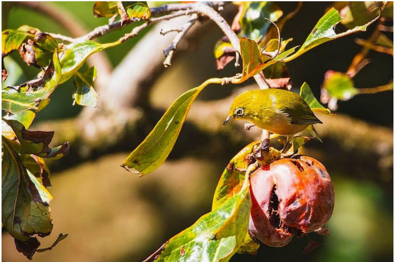
▲メジロ（高良山）

高良山定例探鳥会にも参加させていただきました。御手洗橋付近での、メジロの様子です。