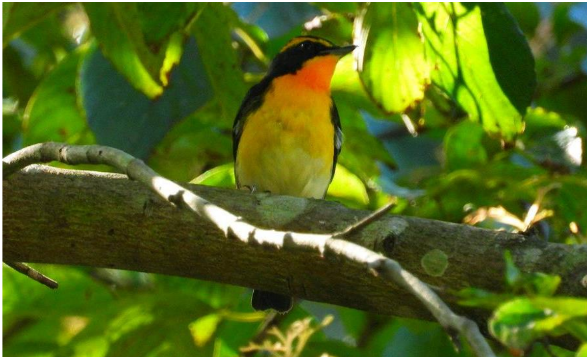
▲キビタキの雄（大津山公園）