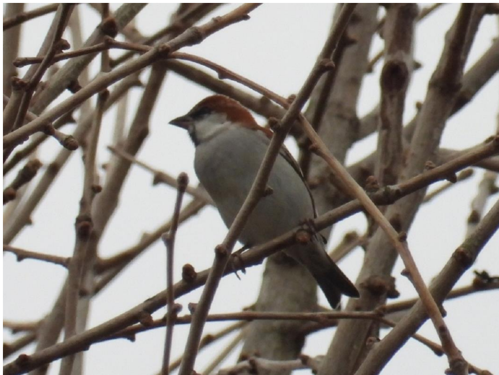
▲ニュウナイスズメ雄・みやま市

清水山での調査のあと、船小屋の矢部川でカモを探鳥中に、ウミアイサの♀がエサ取りをしているのを観察しました。