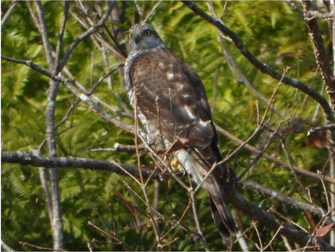
▲ハイタカ・甘木山

日曜日の甘木山探鳥会の前に（雨かもしれない？）ので、大牟田市甘木山⇒大牟田市唐船⇒大牟田市昭和開調整池へ行ってきました。甘木山では、ミサゴが飛び出し少し間を置き、ハイタカ♀？、が飛び出し池の対岸の木に止まりました。初めてのハイタカ止まり木の写真が取れラッキーでした。唐船では、湯牟田堤下に休耕田が連なり、ノスリ ミサゴや小鳥類が居ました。昭和開調整池では、いつものカモ類やカンムリカイツブリ、と、10月末に糸島市にヒシクイを探しに行き会えなかったヒシクイを初めて見れました。