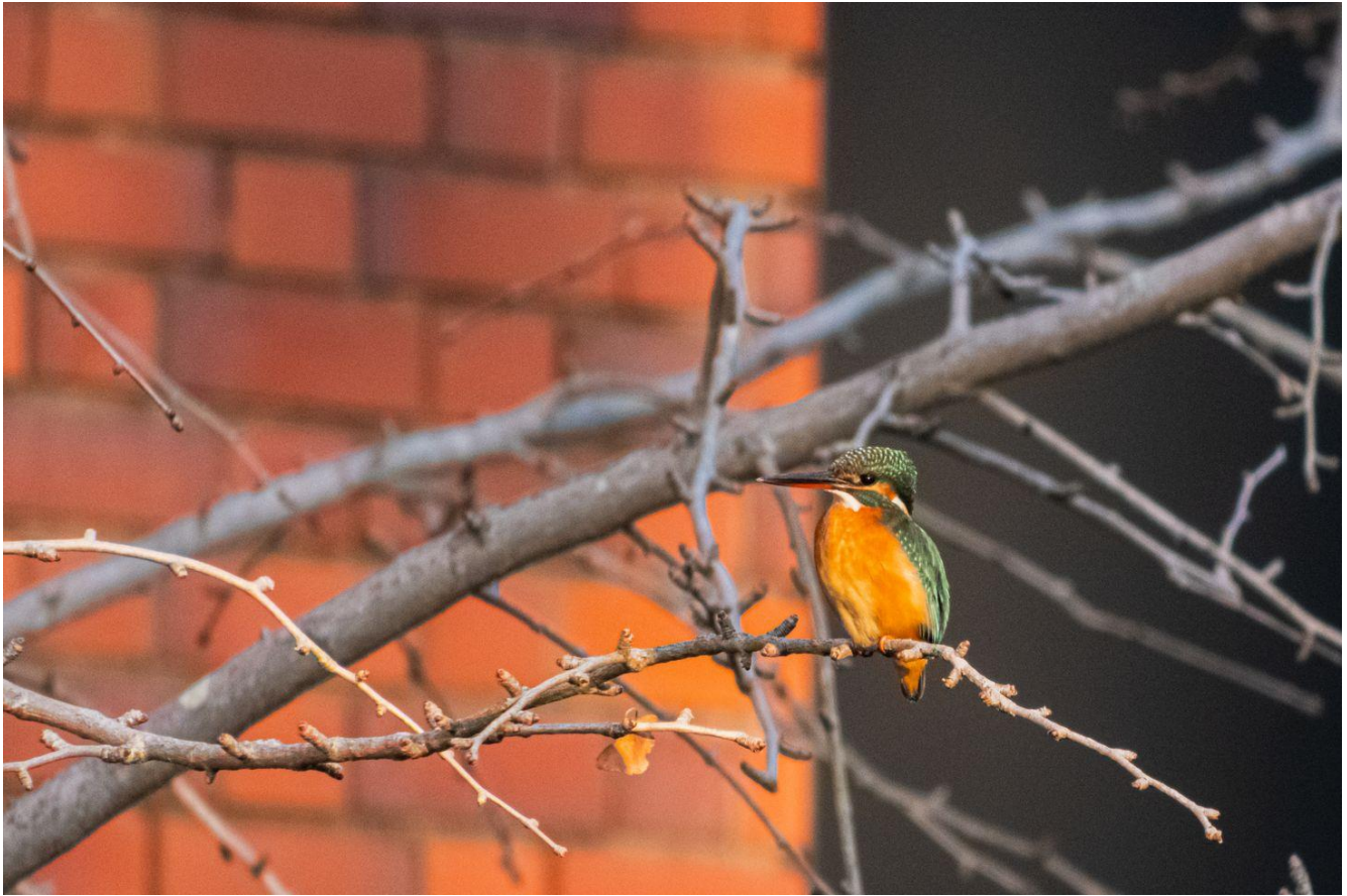
▲カワセミ雌・久留米市

16:25 くらいにカワセミ（メス）が現れてくれました。それからダイブもなく、飛んで行きました。