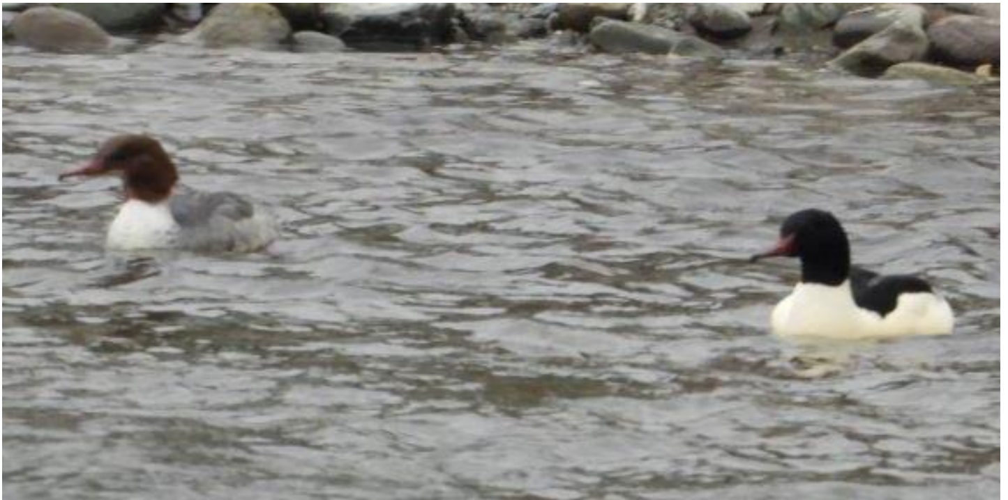
▲カワアイサ雄雌・矢部川

カモ類の探鳥中、昨年ウミアイサ♀を見た場所近くで、今年はカワアイサーが、♂♀のペアで居ました。