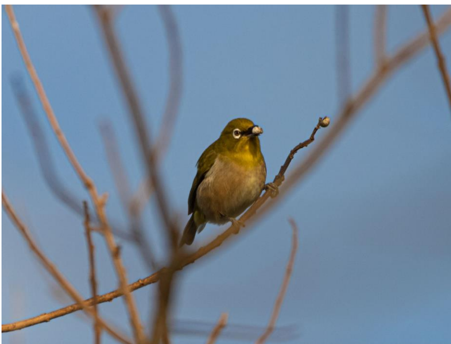
▲クモ?を食べるメジロ・花立山

私にとっては、メジロは花の蜜を吸っているイメージばかりがありますが、図鑑に、「昆虫類、クモ類、木の実などを食べる」とありましたので、納得しました。