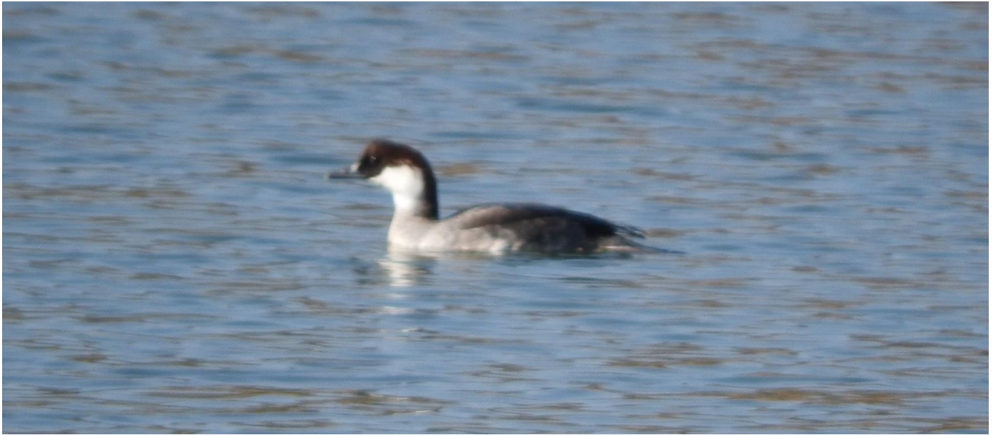
▲ミコアイサ雌・筑後市

十連公園の新池にもう1ヶ月もミコアイサ♀が居ます。オカヨシガモやカルガモ、カイツブリと少し距離を置いた？感じにみえます。