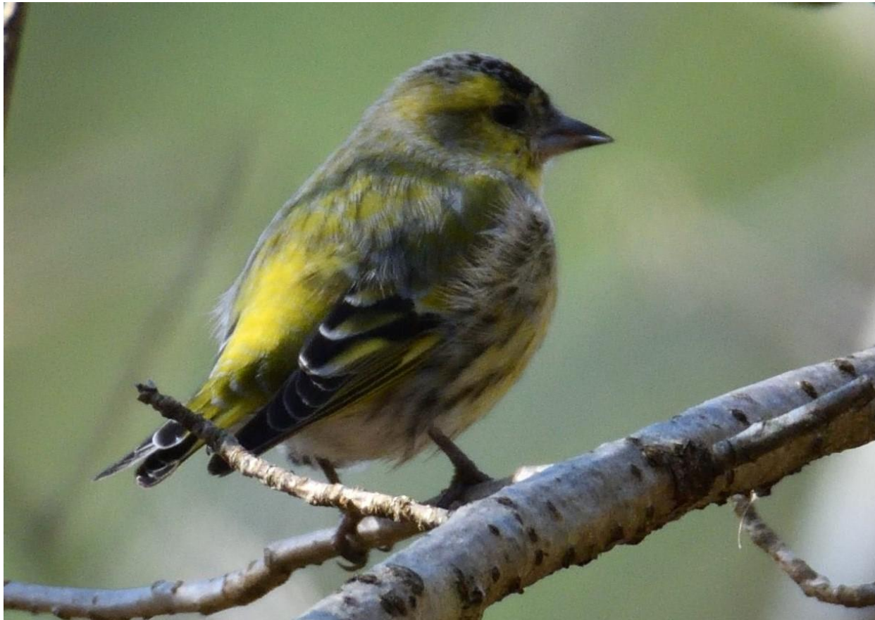
▲マヒワ雄・筑前町

マヒワを探しに、広川町の広川ダムに行きましたが、会えませんでした、途中でチョウゲンボウの♀に会え、その後広川ダムで、ヤマセミに会うことが出来ました。