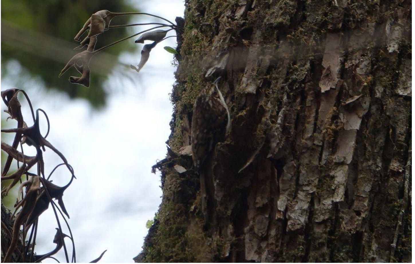
▲キバシリ・大分県

解説) キバシリは佐賀と長崎を除く九州各県で記録がありますが、観察例は少ない鳥です。昨年の観察ですが貴重な記録ですので掲載します。