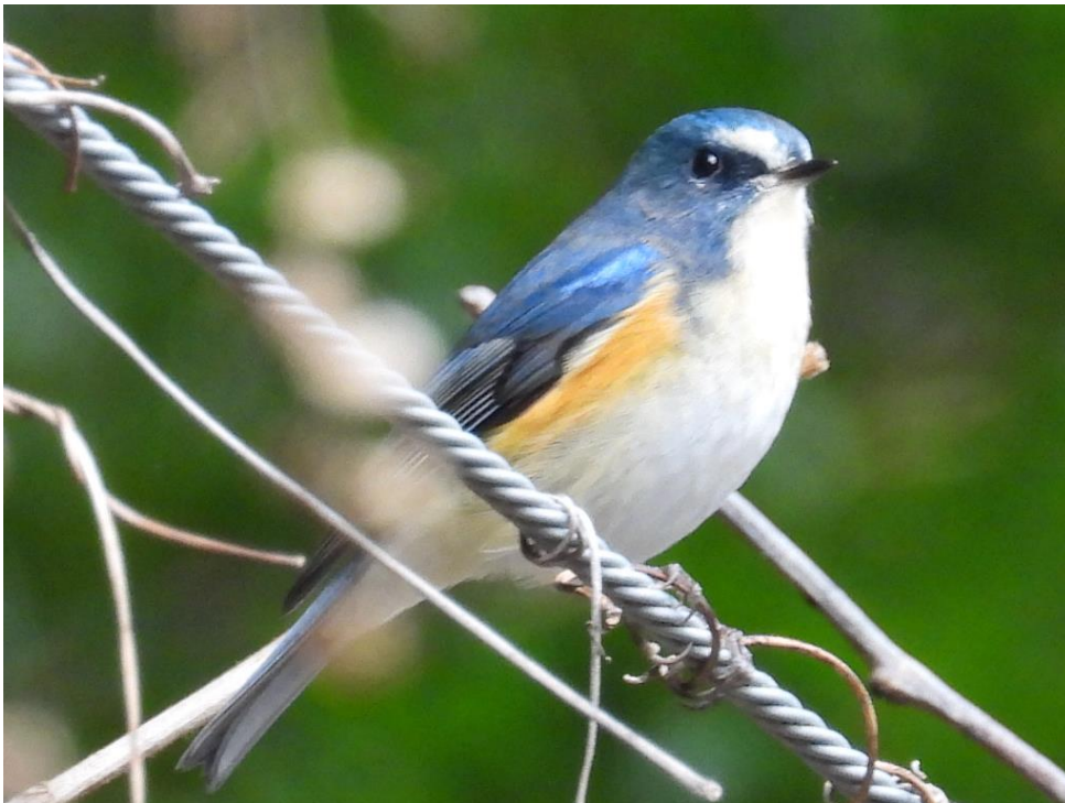
▲ルリビタキ雄・広川町

ダムサイトを1人歩いていると、対岸の林からアオゲラのけたたましい重低音のドラミングが聞こえました。近くからコゲラの軽音のドラミングが聞こえました。ダムに流れ込む溪流部を見下ろすと、一本の木に2羽の雄のカワセミが狩り場の覇権を巡って牽制し合っていました。少し車道を歩くと左のヤマハゼ?にルリビタキの雄がいました。最近あまり出会えなかった雄が観られて感激でした。又、雌も出迎えてくれました。