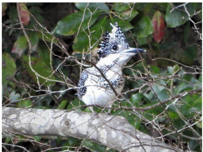
▲ヤマセミ・広川町