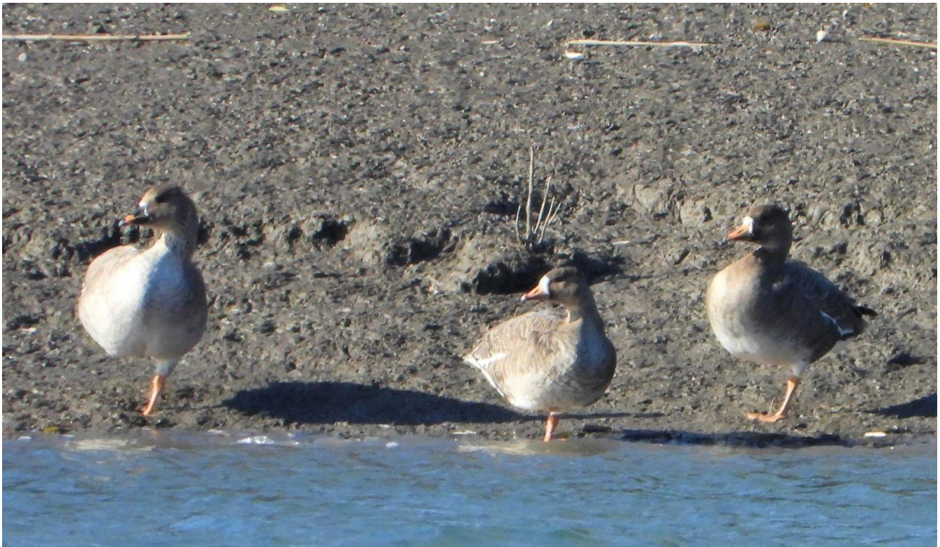
▲左からヒシクイ・マガン2・久留米市大善寺町

筑後川に観察に行きました。トモエガモの他5種、タゲリ、ホオジロなど、探鳥中に佐賀県側の岸辺に、ヒシクイ1羽、マガン2羽が仲良く並んでいました。