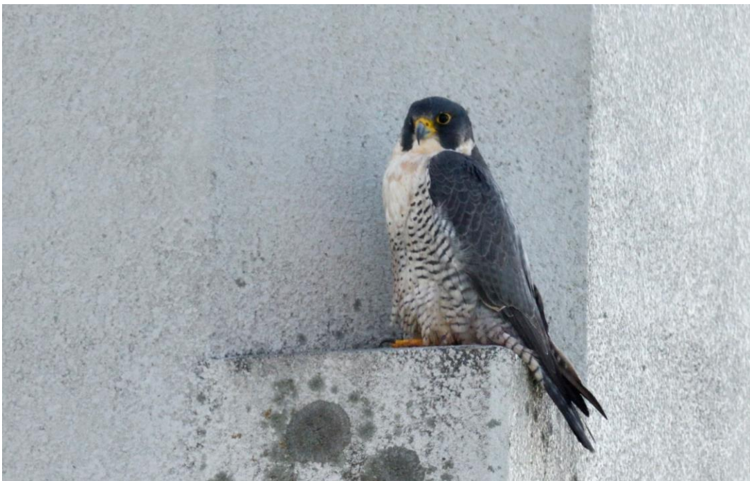
▲ハヤブサ・横島干拓

いつもの探鳥会と比べ圧倒的に多いのですが、2015年以來最小だそうです。しかし、私が確認できたものはもっと少なかったです。でも、ハヤブサやチョウゲンボウ・マナヅル・ケリなど、初めて見たものがほとんどで、楽しい一日でした。