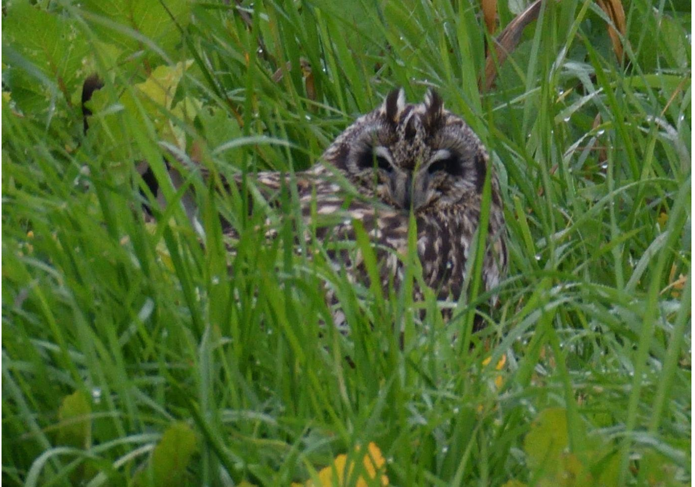
▲コミミズク・筑後川河川敷

久留米市安武町筑後川河川敷駐車場に車を止め、目標ポイントへ向かう途中、私の5mほど先の葦とブッシュの間から、サンタさんのプレゼント「コミミズク」がいきなり飛びだし、近くにの草むらに降りました。