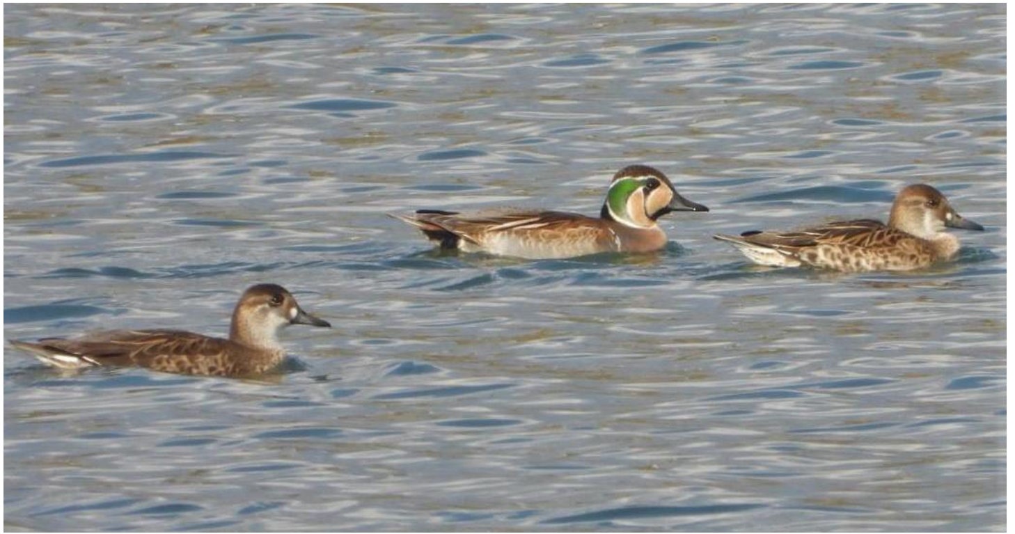
▲トモエガモ雄雌・筑後大堰下流

ベニマシコのオスもメスも3~4回出てくれました。1年振りの再会でしたので、嬉しくてたまりませんでした。ベニマシコは去年好んでセイタカアワダチソウの実を食べていましたが、今回はヘクソカズラの実と黒い実は何でしょうか？