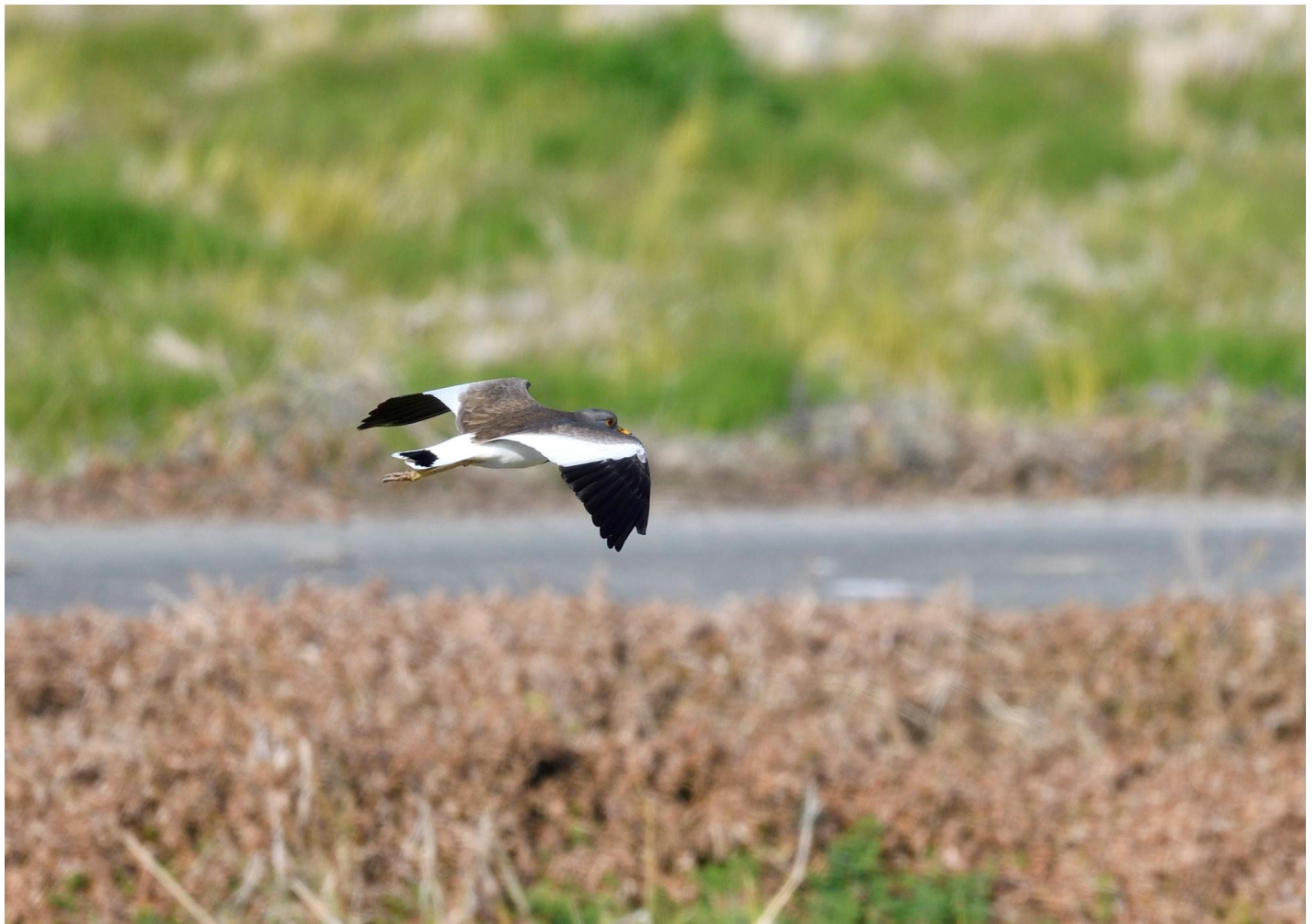
▲ケリ・横島干拓 撮影：西本

ホオジロガモ、オオバン、カイツブリ、カルガモ、カンムリカイツブリ、キンクロハジロ、コブハクチョウ、ハシビロガモ、ホシハジロ、マガモ、ツグミ、ホオジロ、メジロ、キンクロハジロ、スズガモ