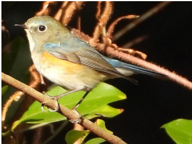
▲ルリビタキ若雄・黒木町