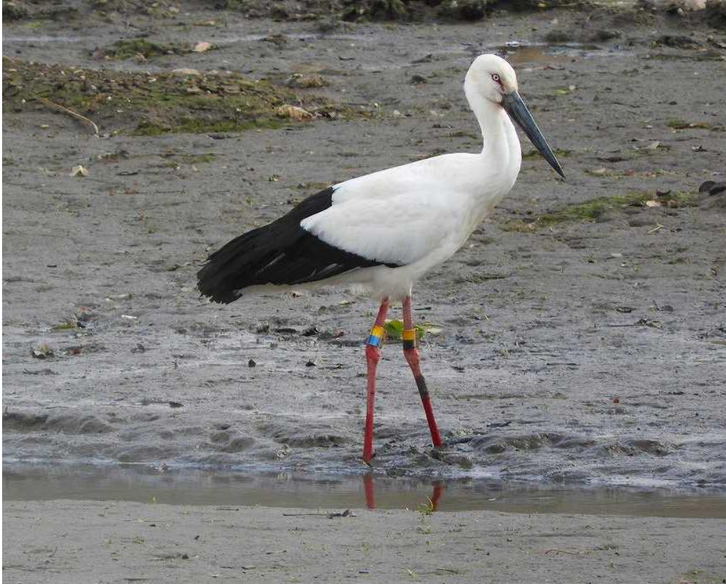
▲コウノトリ・筑後市

今日1時頃、昨年11月に4羽揃って採餌していた蔵数大池にコウノトリが1羽いました。 解説) 以前も観察されたJ0133 (左:黄青・右:黄黒) 2016.04.25 生♀のようです。