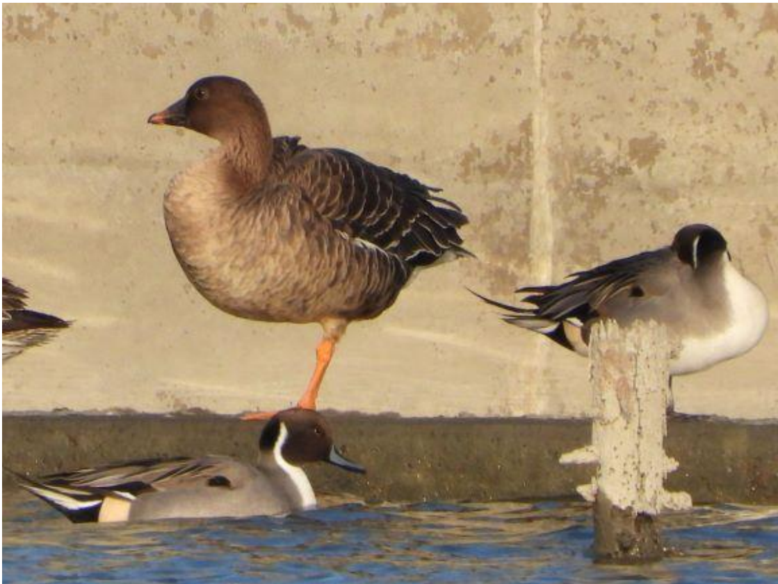
▲ヒシクイ・昭和開調整池