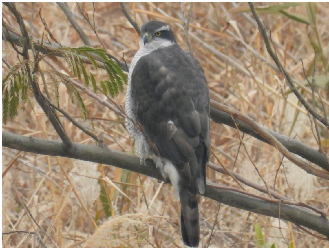
▲オオタカ・筑後市

川北側の小さな中州の小さな木に小さな黒い塊を見つけ、なんと オオタカが止まっていました。色んなポーズを見せてくれました。