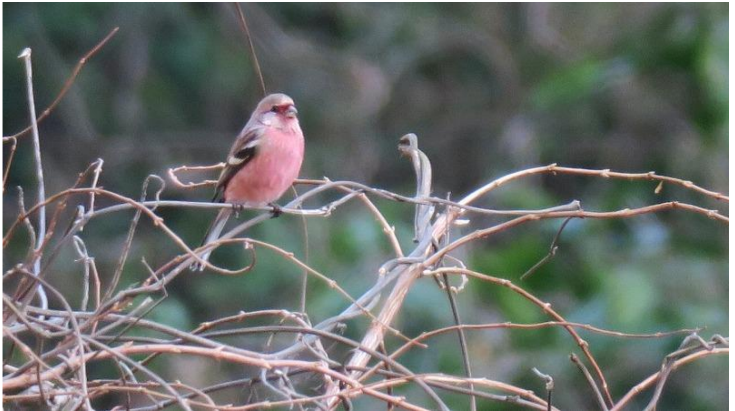
▲ベニマシコ雄・山神ダム

ベニマシコのオスもメスも3~4回出てくれました。1年振りの再会でしたので、嬉しくてたまりませんでした。ベニマシコは去年好んでセイタカアワダチソウの実を食べていましたが、今回はヘクソカズラの実と黒い実は何でしょうか？