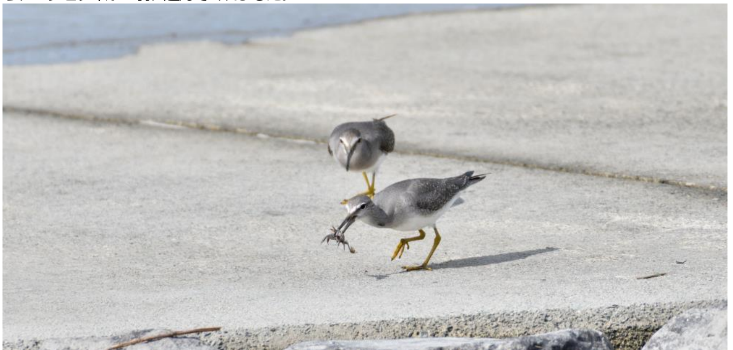
▲キアシシギ

観察できたのは、ムナグロ、ダイゼン、メダイチドリ、オオメダイチドリ、トウネン、キリアイ、ハマシギ、サルハマシギ、コオバシギ、オバシギ、コアオアシシギ、アオアシシギ、キアシシギ、オオソリハシシギ、ダイシャクシギ、ホウロクシギに加え、ハヤブサ、ミサゴ、トビ、ダイサギ、アオサギ、ツバメ、ハクセキレイといったところです。ヒメハマシギは干潟で確認された方がいました。ハヤブサの若鳥が3度アタックに来て、その都度、シギたちを飛ばしてくれましたが、3回とも空振りみたいでした。 帰りに鳥栖市の朝日山公園に寄ったら、エゾビタキが2羽、遊んでくれました。