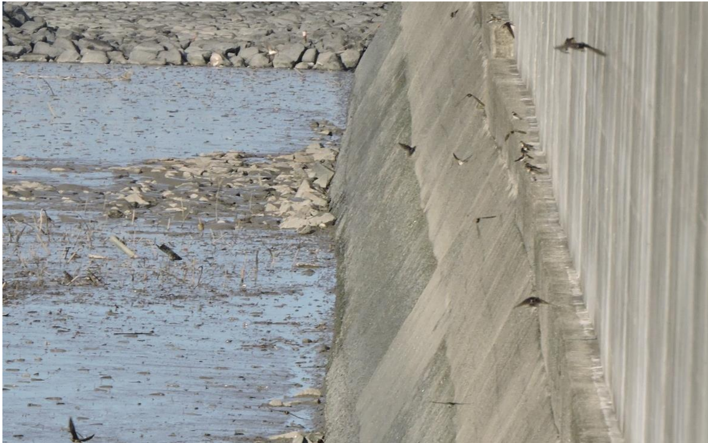
▲ショウドウツバメ（沖の端川最河口右岸）

20日の矢部川河口右岸と沖の端川右岸、21日の筑後川河口右岸の調査では、ショウドウツバメが沢山いました。