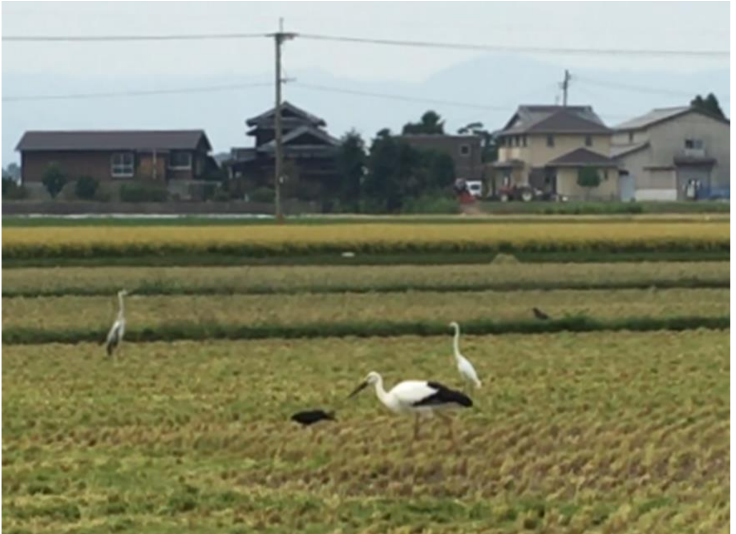
△コウノトリ

小郡市古飯東の交差点から 100m 南に行ったところの田んぼでコウノトリを 1 羽見かけました！ 稲刈りのトラクターについて餌を食べていました。