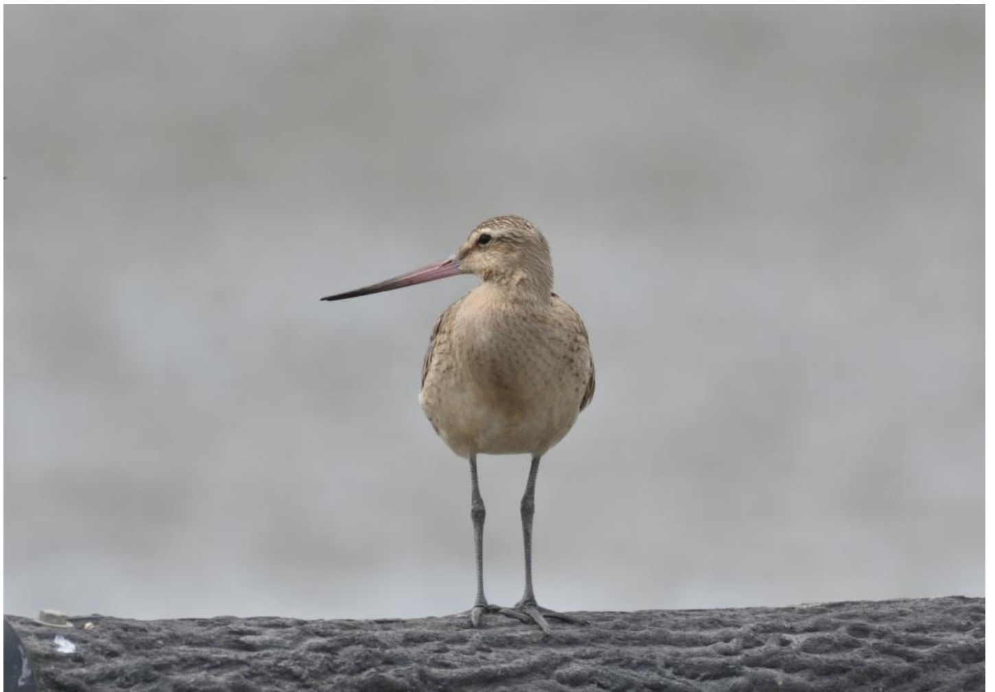
▲オオソリハシシギ