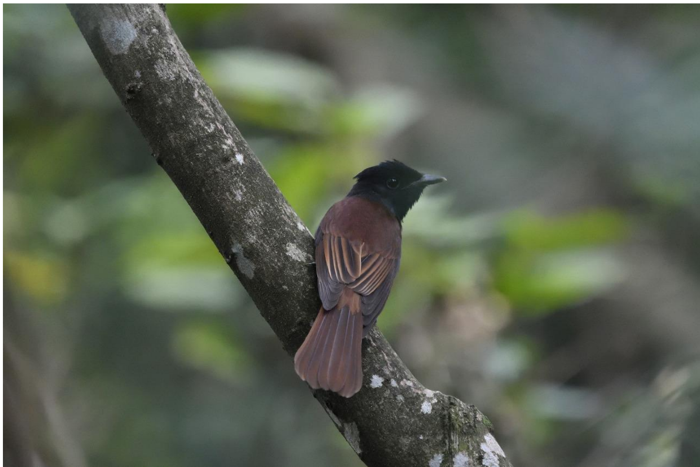
▲サンコウチョウ（雌）