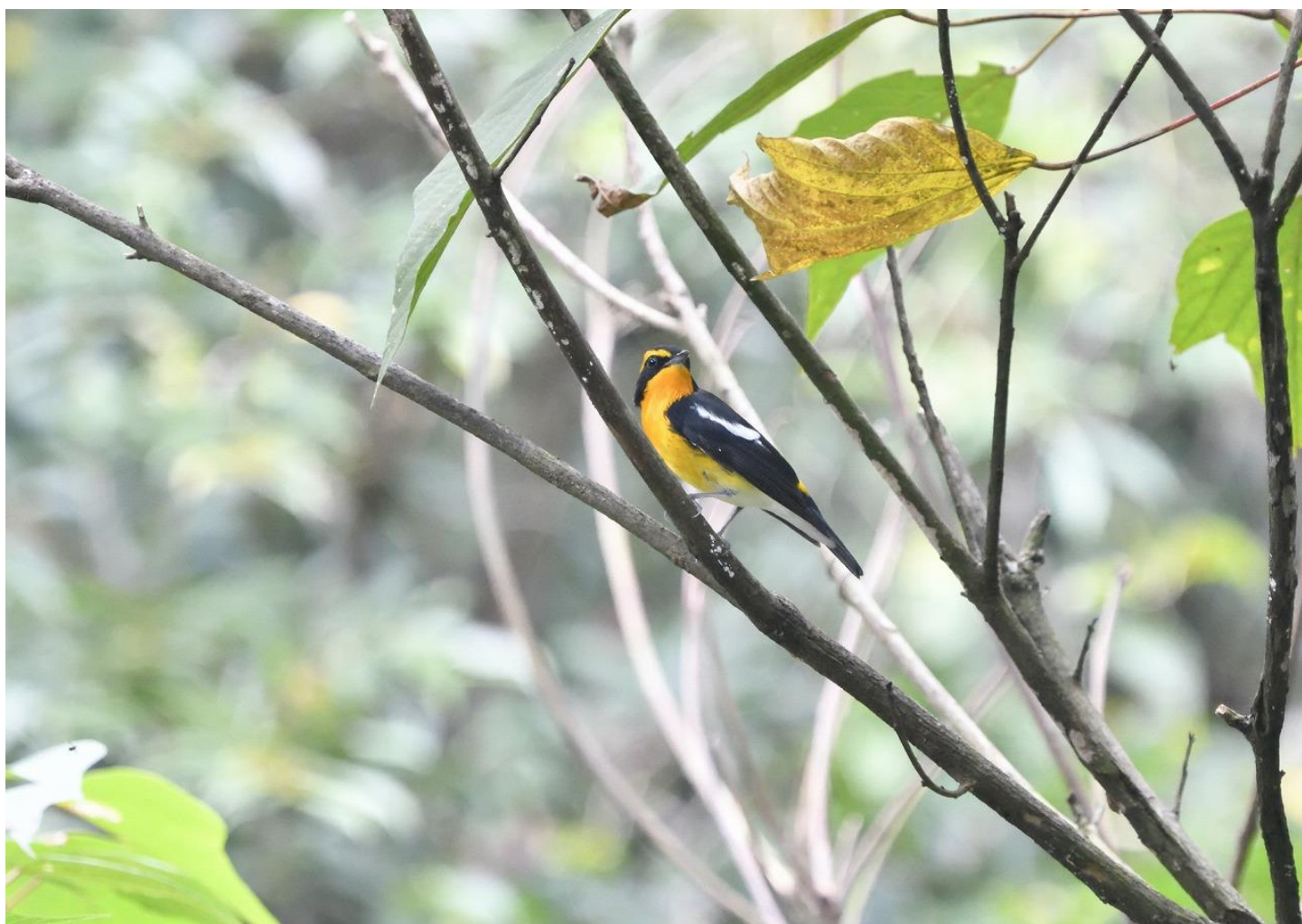
▲キビタキ（雄）