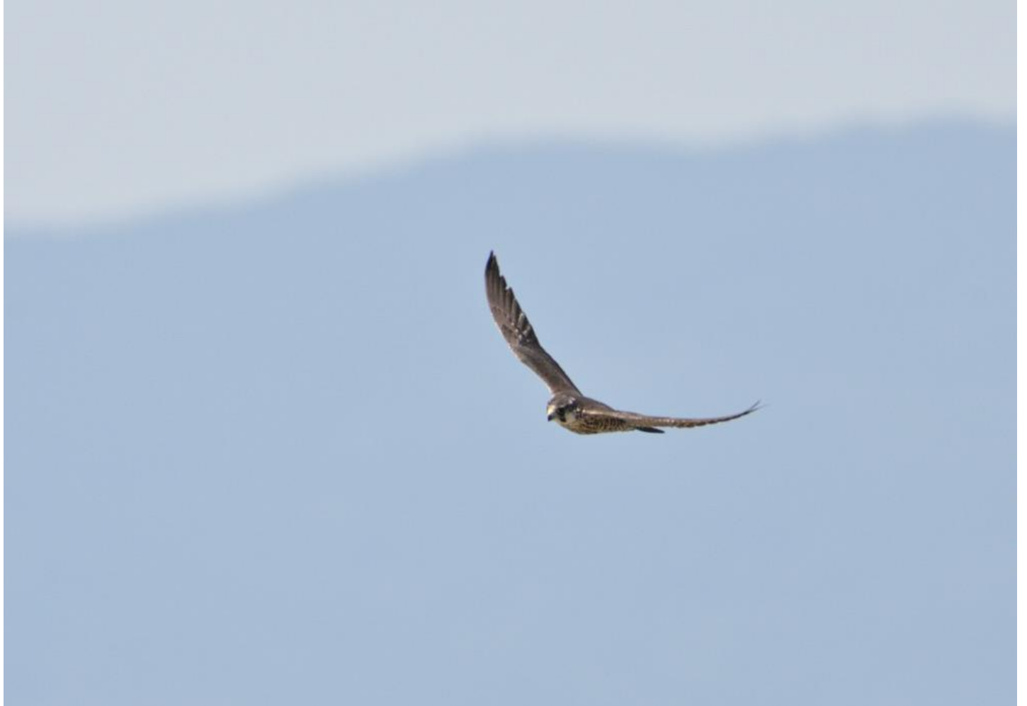
▲ハヤブサ