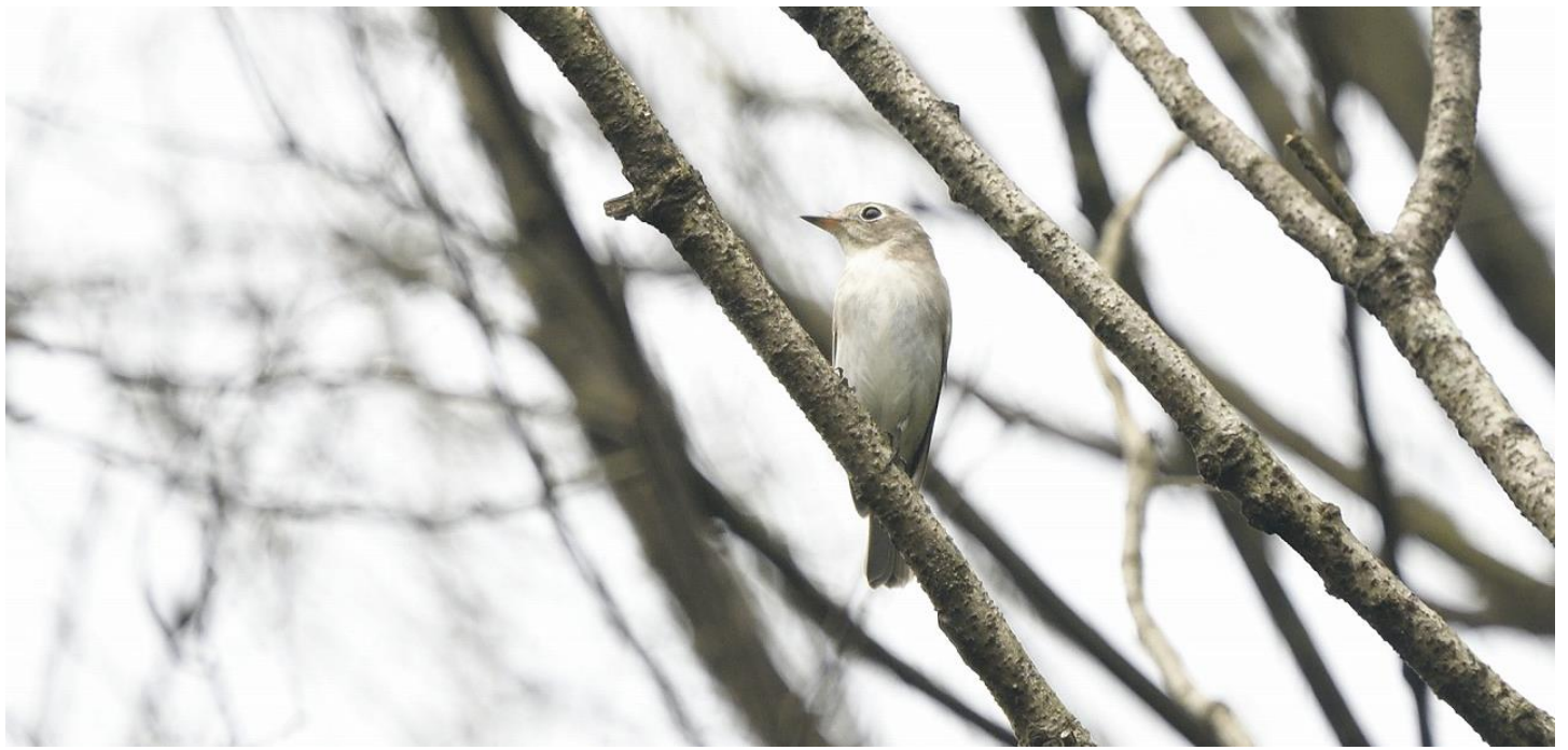
▲コサメビタキ